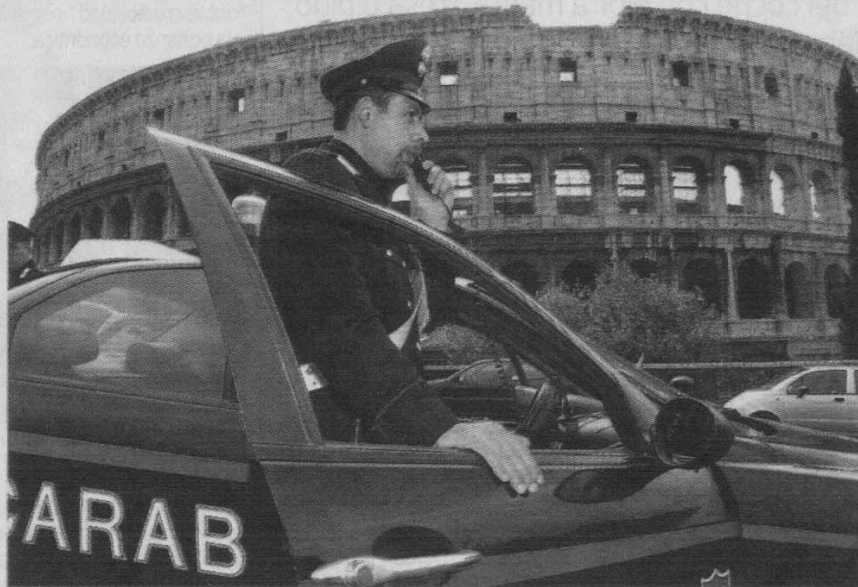
Los carabinieri italianos tendrán que estar cada día más atentos a las costumbres de los niños italianos.

Un informe del Gobierno italiano revela que allí se produce el primer contacto con drogas a los 11 años, en concreto los cigarrillos de marihuana o hachís. Según el informe, en consonancia con el resto de la UE, la edad media de los consumidores de drogas ha bajado en poco tiempo, de los 25-34 años en la década de los 90, a los 15-19 actuales, mayoritariamente por la bajada de los precios. ¿Y en España? Los primeros contactos se retrasan a los 13 años pero los que consumen son más (17,3%), que en Italia (9,2%). Los expertos consultados aseguran que la convivencia con drogas, aunque distante, es inevitable por su gran extensión social.